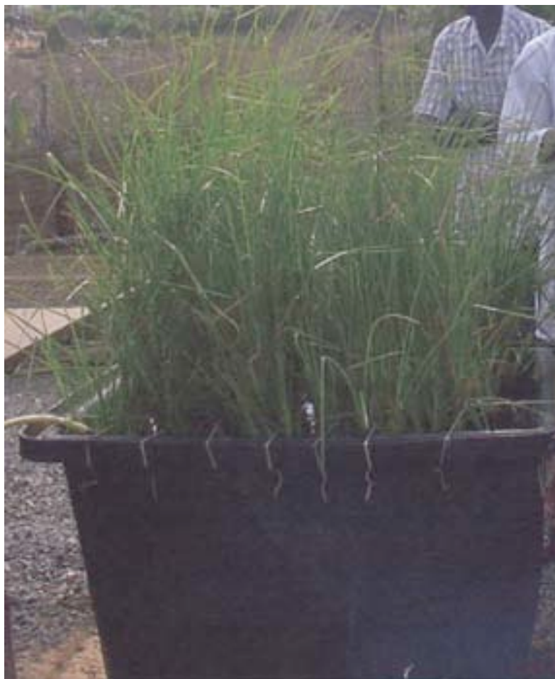
PHOTO 1 : Vue d'un des bassins à vetiver après deux mois de fonctionnement

Les prélèvements d'échantillons sont quotidiens et se font à l'entrée du bassin d'eau libre et à la sortie de chacun des trois bassins. Tous les jours, un échantillon instantané de 80 ml est prélevé à heure fixe et conservé dans un flacon gardé au surgélateur. Cette opération répétée pendant quinze jours successifs permet d'obtenir un échantillon moyen de 1200 ml sur lequel est réalisée l'analyse des matières en suspension (MES) et de la demande chimique en oxygène (DCO). Le dénombrement des coliformes fécaux (CF) est effectué sur un échantillon instantané prélevé le jour des analyses.